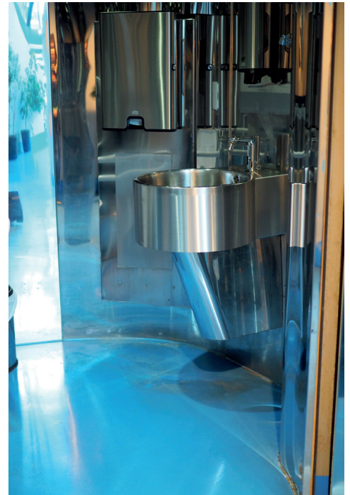
Waschbecken im WC