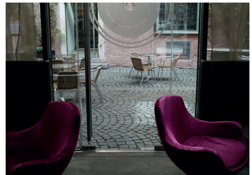
Zugang zu Innenhof