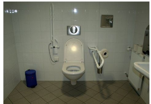
WC und Plan WC