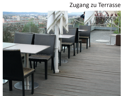
Zugang zu Terrasse