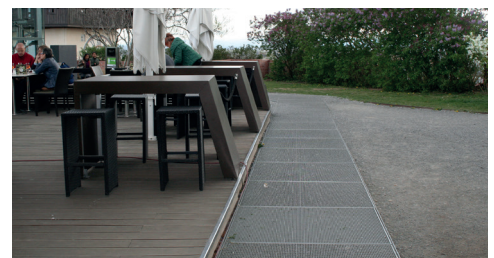
Zufahrt zu/von Lift