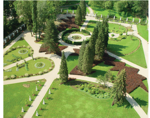
Planetengarten bei Achäologiemuseum