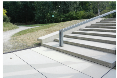
Zugang barrierefrei (Schotterweg) & Stufen