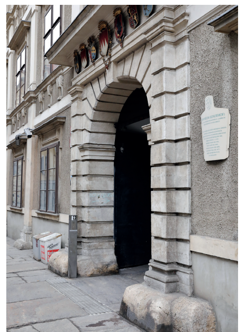
Zugang Raubergasse mit Info-Stele für blinde Menschen