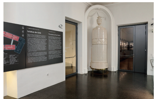
Türen zur Ausstellung