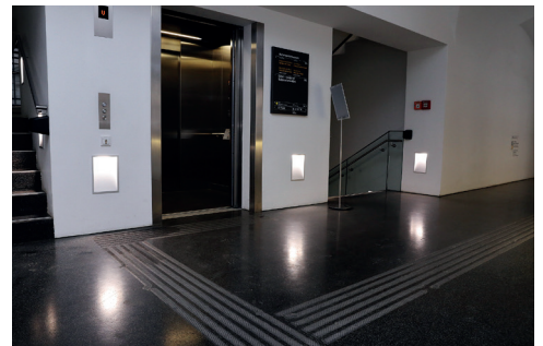
Lift und Treppe zu Foyer und Ausstellung