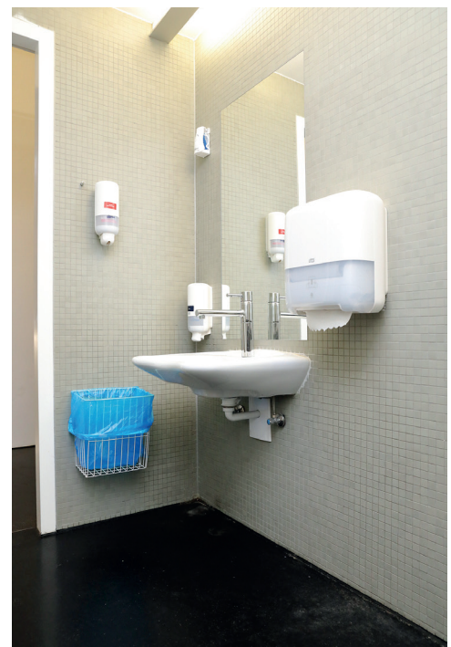
Barrierefreies WC im 2. OG