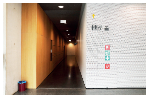
Schließfächer und Zugang WCs