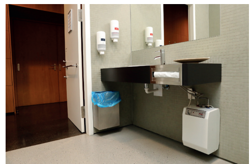
Barrierefreies WC im 2. UG