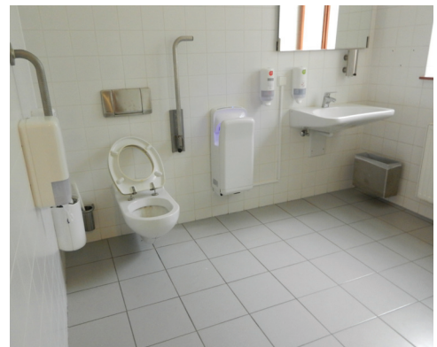
barrierefreies WC Park