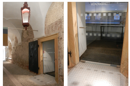
Rampe Zugang/Eingang Münzkabinett