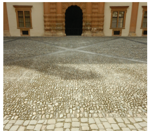
Pflasterung Innenhof „Murnockerl“