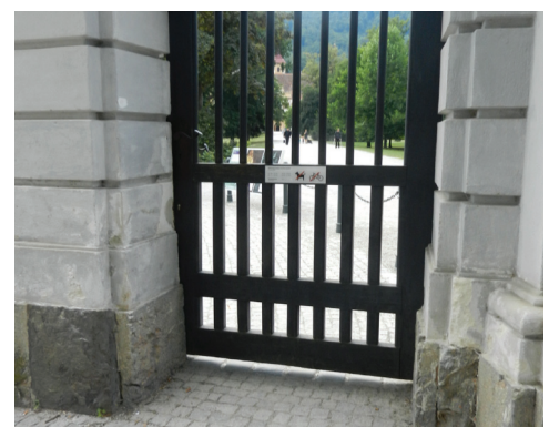
Eingangstor zu Schlosspark