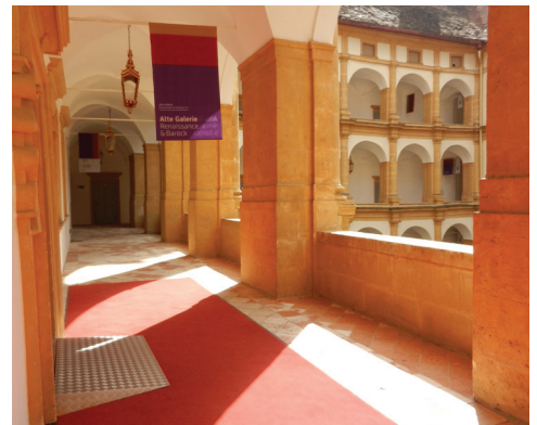
Ausgang Alte Galerie