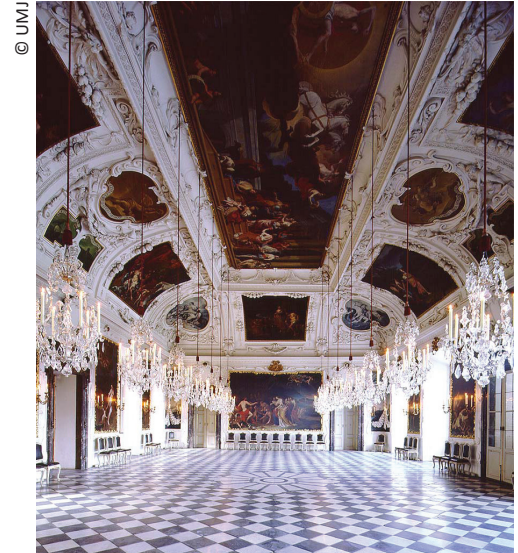
Planetensaal und Prunkräume