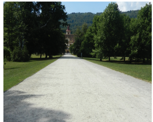
Weg zu Schloss