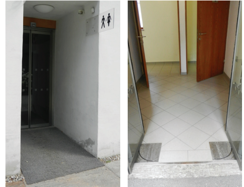
Eingang barrierefreies WC Park