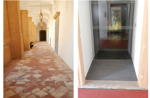
Zugang/Eingang Alte Galerie