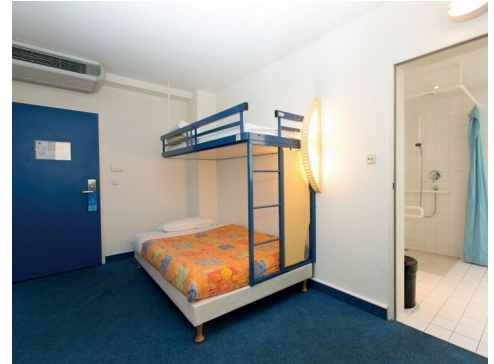
Zimmer mit Eingang zu Bad