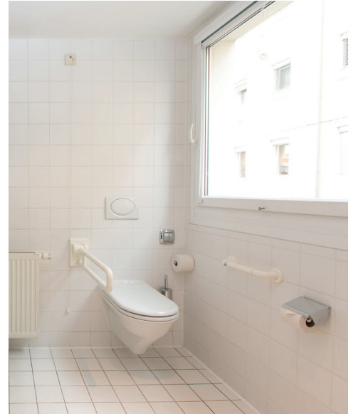
WC im Bad