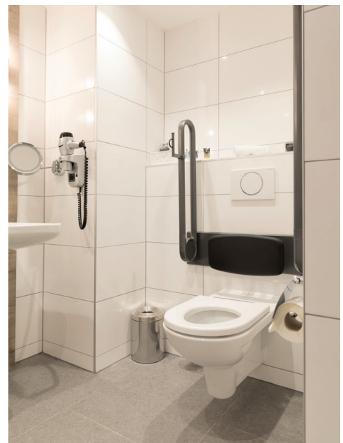
Bad Zimmer Nr. 417