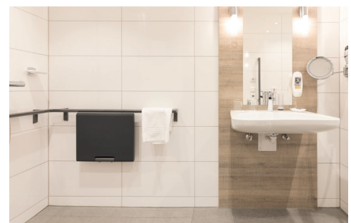
Bad Zimmer Nr. 417