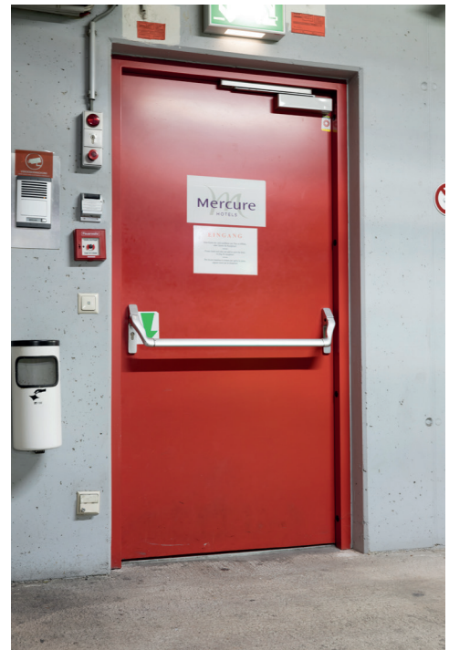
Hotelzugang von der Tiefgarage