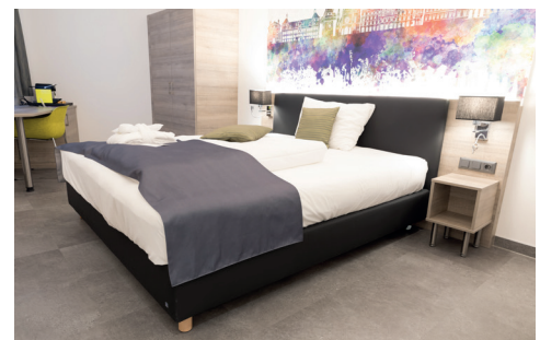
Barrierefreies Zimmer Nr. 417