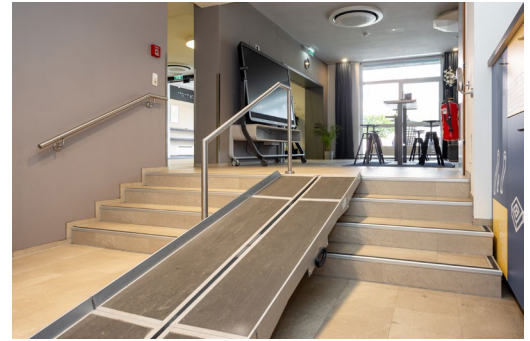
Mobile Rampe zum Seminarraum