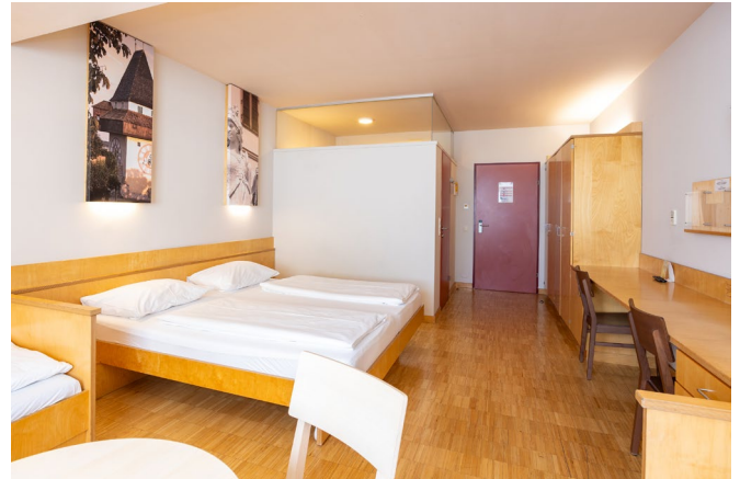
Zimmer Nr. 154