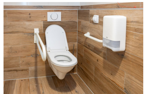
Allgemeines barrierefreies WC