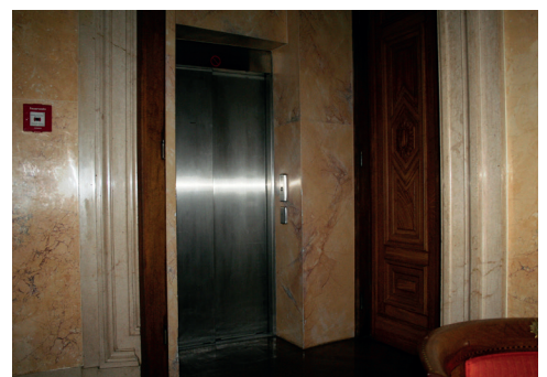
Lift Ausgang Veranstaltungsräume