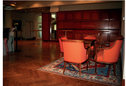
Foyer & Bar