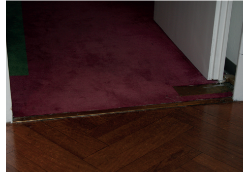
Übergang zu WC